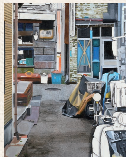
「ふとした瞬間で」西本 優希 明誠学院高等学校(岡山県) 油彩画