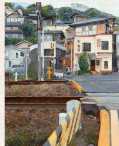
「街」目木 菜々美 明誠学院高等学校(岡山県) 油彩画