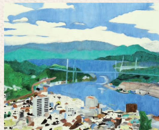
「橋と風景」堀込 結人 群馬県立前橋東高等学校(群馬県) 油彩画